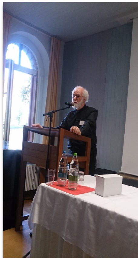
Dr. Rowan Williams

Rowan Williams was van 2002 tot 2012 Aartsbisschop van Canterbury en schreef meerdere theologische boeken en artikelen over Dietrich Bonhoeffer