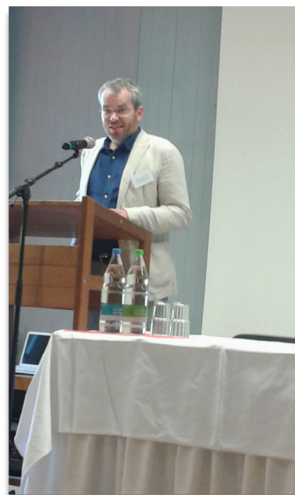
Afgevaardigde Nederlandstalige sectie