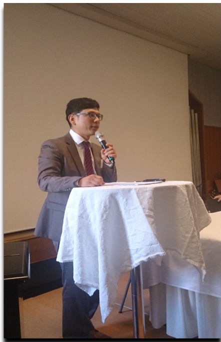
Afgevaardigde Zuid Korea

Aan het slot van de ochtendbijeenkomsten werden afgevaardigden van de verschillende secties in de gelegenheid gesteld iets te vertellen over de wijze waarop zij met Bonhoeffer werken, hoe vaak ze bij elkaar komen en welk soort activiteiten zij organiseren etc.